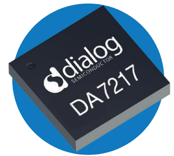
32 球状引脚 WL-CSP 封装，0.5 毫米间距

DA7217 具有差分耳机输出，并且专为耳麦设备内部使用所设计。该系列中的另一种芯片 DA7218 有单端耳机输出，并且专为结合耳机检测所设计，适合用于配件中。